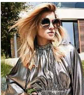
XL-Gläser und Fassungen im Animal-Print sorgen diesen Sommer für Extravaganz.