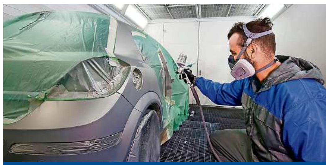
Im Autohaus Dresden stehen zwei Lackierkabinen für Arbeiten zur Verfügung.