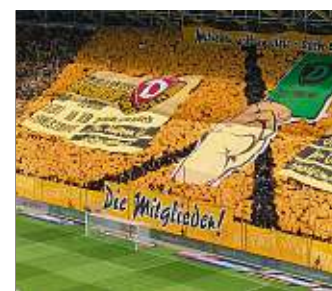
Mit einer beeindruckenden Choreografie trugen Fans zu einem rundum gelungenen Spieltag bei.