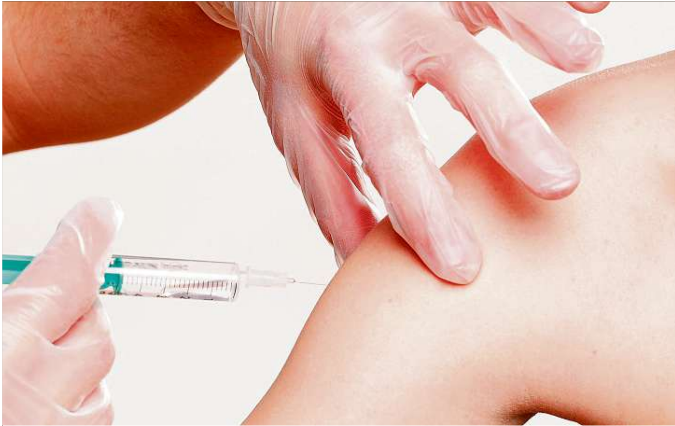
Nur ein kleiner Pieks, schon ist die Impfung geschafft. Nach dem zweiten Pieks ist der Schutz vollständig.