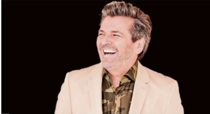
Thomas Anders kommt mit seiner „Ewig mit Euch“-Tour am 3. Mai in die Messe Dresden.