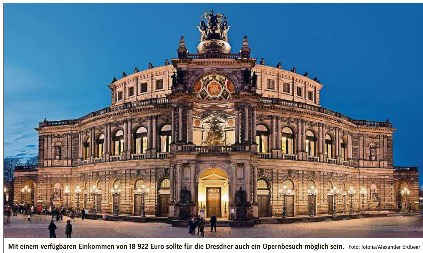
Mit einem verfügbaren Einkommen von 18 922 Euro sollte für die Dresdner auch ein Opernbesuch möglich sein.

In den neuen Ländern wächst das verfügbare Einkommen, manche westdeutsche Städte dagegen werden ärmer. Wer in den neuen Ländern viel Geld hat, der wohnt gerne im Umland der großen Städte: an einem See oder im Grünen bei Potsdam, Dresden oder Leipzig. Spitzenreiter im Osten sind die Bewohner des Landkreises Potsdam-Mittelmark mit 21 746 Euro im Jahr. Steuern und Sozialabgaben sind dabei bereits abgezogen. Auch die Kreise Meißen und Leipziger Land gehören zu den sechs Landkreisen in den neuen Ländern, in denen das verfügbare Einkommen über 20 000 Euro im Jahr liegt – sechs Kreise von 77. Im Westen dagegen liegen nur 40 von 324 Kreisen un-