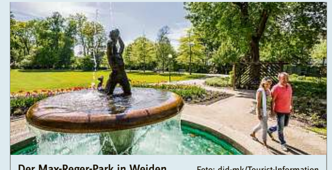
Der Max-Reger-Park in Weiden

Vor gut 100 Jahren gehörte die Orgel zu den bedeutendsten Instrumenten in der konzertanten und kirchlichen Musik. Größter Orgelkomponist des 20. Jahrhunderts war Max Reger, Zentrum seines Schaffens war die Oberpfalz. Zu Ehren des Komponisten erklingt seit 2007 in St. Michael in Weiden die „Max-Reger-Gedächtnisorgel“. Zudem veranstaltet die Stadt jährlich von Mitte September bis Anfang Oktober die Weidener Max-Reger-Tage. Nähere Informationen zum Klassik-Festival finden Interessierte im Internet unter www.maxregertage.de. Doch nicht nur musikalisch lebt Max Reger in Weiden fort. Auch viele Plätze erinnern an ihn.