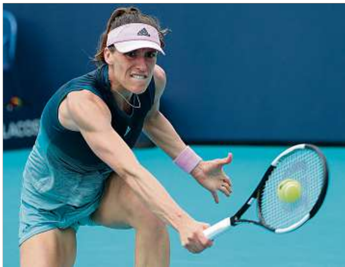
Andrea Petkovic wird für den TC Blau-Weiß Blasewitz bei den Heimspielen antreten.