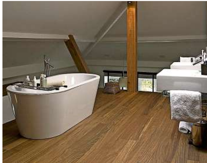
Holz wirkt edel - gut verarbeitet kommt es auch mit Nässe im Bad klar. Foto: pik - Parkett im Klebeverbund / Sanitär Wahl GmbH (Livinghouse)

Ganze 45 Minuten am Tag verbringen die Deutschen im Durchschnitt im Bad und vor dem Kleiderschrank. Bei so viel Lebenszeit sollte das Bad nicht nur praktische Nasszelle, sondern gemütlicher Raum sein. Und was macht eine Wohnung richtig gemütlich? Ein schöner Holzboden. Wer jetzt an überlaufene Badewannen denkt, sollte überlegen, wie häufig dieser Fall eintritt, zumal es an jeder Sanitärkeramik entsprechende Überlaufarmaturen gibt. Fakt ist: Ein natürlicher und angenehmer fußwarmer Parkettboden passt perfekt ins Bad. Wichtig ist jedoch, das passende Holz zu wählen. Ungünstig ist zum Beispiel Buche, die beim Kontakt mit Wasser sowie unter hoher Temperatur und Luftfeuchtigkeit schnell quillt und bei kaltem und trockenem Raumklima schwindet. Gut eignen sich hingegen härtere Tropenhölzer wie Doussie, Merbau und Teak aus nachhaltiger Forstwirtschaft, die sich