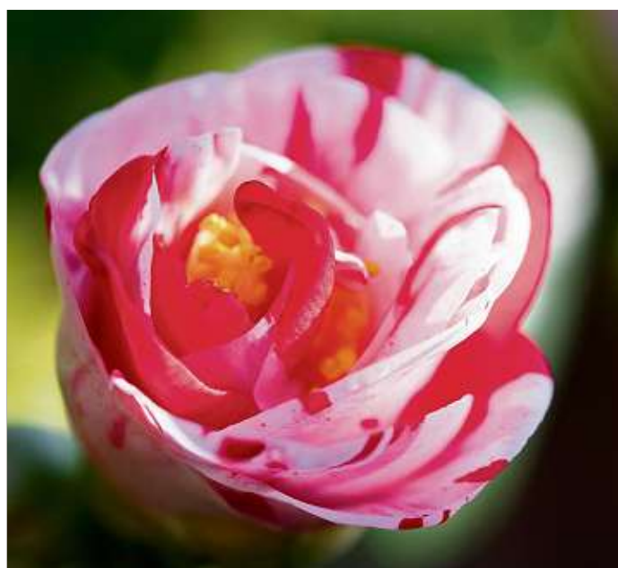
Ein Prachtexemplar aus der Kameliensammlung im Schloss Königsbrück.

Es ist immer wieder wie aus einem Märchen: Wenn alles noch kahl ist, blüht der immergrüne Kamelienstrauch Camellia japonica (auch bekannt als japanische Rose oder auch Chinarose) bereits üppig und wunderschön. Weder