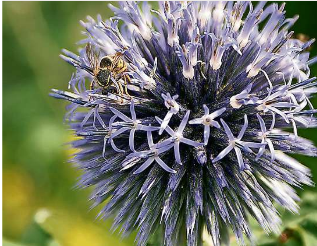
Die Kugeldistel ist anspruchslos - und beliebt bei Hummeln und Co.

Auch Kugeldisteln verkraften Sonne pur – und sind dazu noch sehr anspruchslos, was den Boden angeht. Wer diese Staude im Garten hat, weiß, wie begehrt sie für Hummeln, Bienen und auch Schmetterlinge ist.