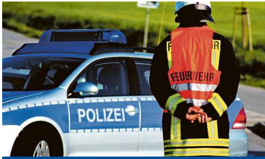
Neue Autos müssen mit dem Notrufsystem eCall ausgerüstet sein, das automatisch die Einsatzkräfte alarmiert.

Kommt es zu einem schweren Autounfall, bei dem die Airbags auslösen, sendet das System automatisch einen Notruf. Bei Parkremplern passiert dagegen nichts. Das Notrufsystem kann aber bei