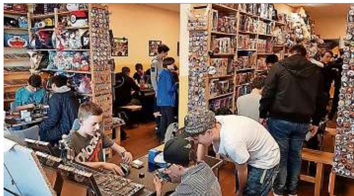
Viele Jugendliche verbringen ihre Freizeit gern im Comic-Tempel.