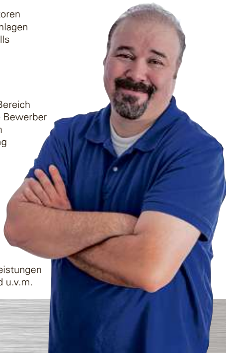
EFAFLEX Tor- und Sicherheitssysteme GmbH & Co. KG - Fliederstr. 14 - D-84079 Bruckberg

Mehr Infos unter: www.efaflex.com Oder direkt bewerben bei kariere@efaflex.com