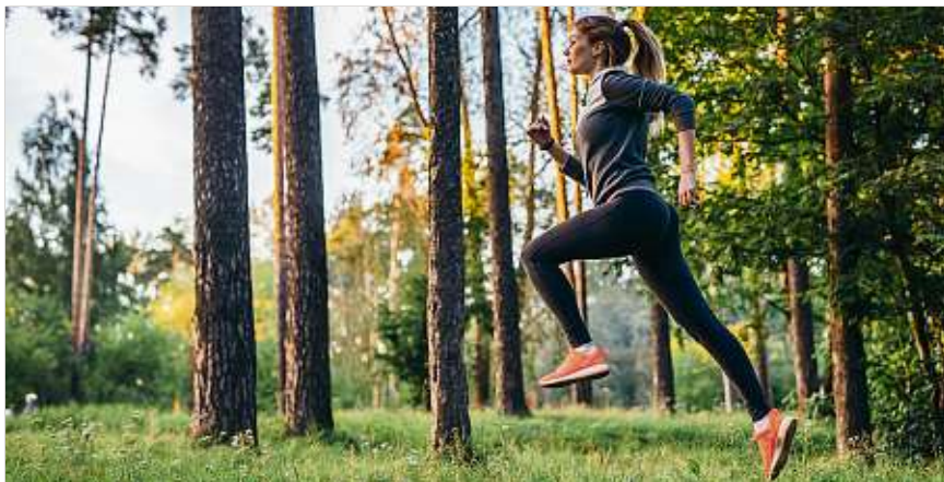
Joggen trotz Allergie ist mit einer entsprechenden Aufwärmphase gut möglich. Besonders geeignet ist die Luft nach Regen.

So sollte eine Aufwärmphase von mindestens 15 Minuten fest zum Trainingsprogramm gehören, denn sie