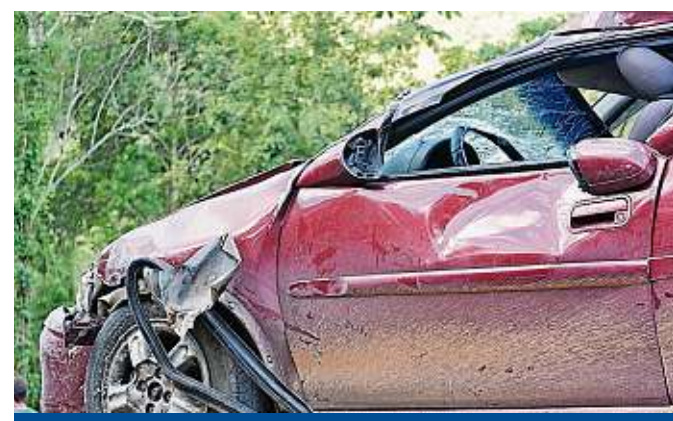
Nach einem Unfall herrscht oft noch Einigkeit darüber, wie der Schaden zustande kam.

► Autohaus Dresden Bremer Straße 18 A 01067 Dresden www.autohaus-dresden.de