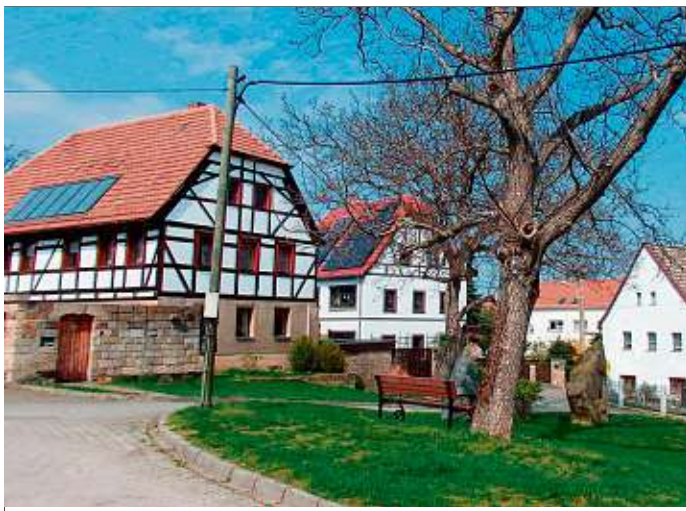
Am beschaulich grünen Dorfplatz stehen denkmalgeschützte Gehöfte.

Mobschatz – das klingt geheimnisvoll nach „Gesindel“ und vergrabenen Kostbarkeiten. Gefunden haben in dem Dresdner Stadtteil sogar Archäologen kaum etwas. Seinen Namen erhielt der Rundweiler auf dem Steilhang an der Lößebene des Wilsdruffer Hochlandes von Slawen, die dort im 9./10. Jahrhundert ansässig wurden. Auf deren Gottheit der Fruchtbarkeit und des Wassers „Mokoš“ geht der Dorfname zurück, der erstmals 1091 als Mocozeice einer Schenkungsurkunde des Kaisers Heinrich IV. an das Hochstift Meißen auftaucht.