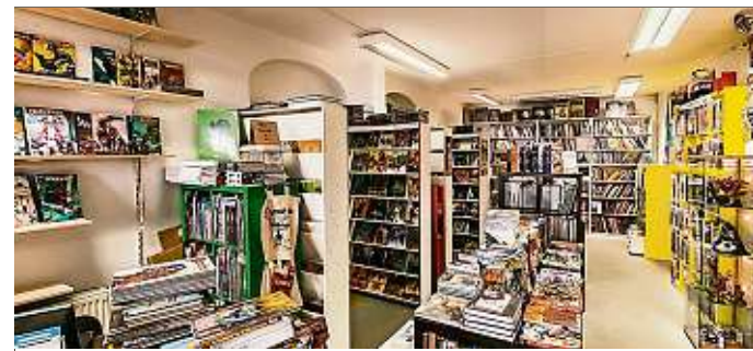
Das Comic-Sortiment ist in Dresden einzigartig.