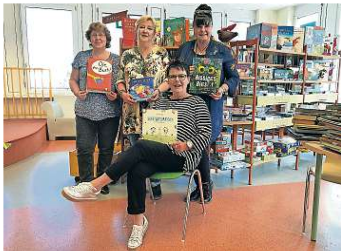
Die Mitarbeiterinnen der Bibliothek in Prohlis präsentieren ihre liebsten Kinderbücher.