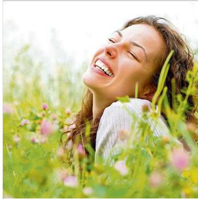
Pollen - na und? Die schönen Seiten der warmen Jahreszeit genießen ohne nervigen Heuschnupfen - das wünschen sich viele Allergiker.

Treten die Beschwerden auf, sollten sie unbedingt behandelt werden - zum einen zur Linderung, zum anderen, um Folgeerkrankungen wie Asthma zu vermeiden. Darum raten Ärzte zuerst zum Besuch beim Allergologen. Denn bei starken Allergien ist oft eine Hyposensibilisierungstherapie, die über mehrere Jahre geht, sinnvoll. Auch verschreibungspflichtige Präparate mit Kortison können