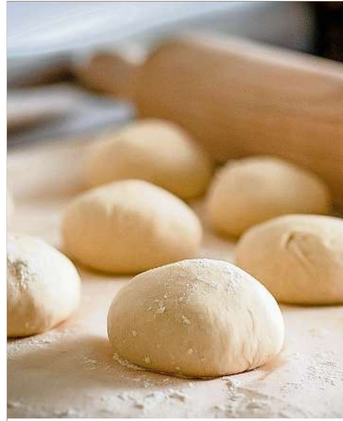
Innerhalb der vergangenen zehn Jahre musste ein Viertel der Bäckereien in Sachsen schließen.

Die Zahl der Bäckereien und Fleischereien ging 2018 weiter zurück. Vergangenes Jahr gab es knapp 1 000 Bäcker (rund 22 Prozent weniger als 2008) und 650 Fleischer (etwa 23 Prozent weniger). Der Zentralverband des Deutschen Bäckerhandwerks erklärt das Verschwinden der Betriebe mit dem Strukturwandel: Anders als früher haben Bäckereien meist mehrere Verkaufsstellen. Kleinere Bäckereien werden oft von größeren Betrieben mit Filialnetz übernommen. Dazu machen immer mehr Supermärkte, Back-Shops und Tankstellen den Handwerksbetrieben Konkurrenz. Junge Menschen hätten heute mehr Freiheit bei