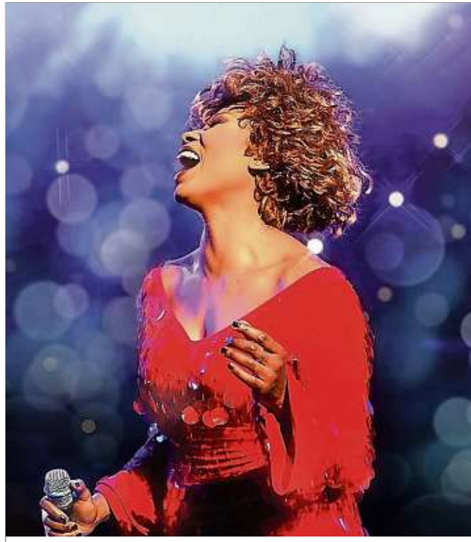
Genug Strom für die Ewigkeit: Sieht nicht unbedingt so aus, als hätte Tina Turner ihre Karriere wirklich beendet.

schaltete und waltete bereits für „Elvis - Das Musical“ sowie „Thank You For The Music - Die ABBA-Story“. Das Timing fürs Tina Turner-Musical scheint jedenfalls nahezu perfekt gewählt: Vor 35 Jahren erschien ihr mit vier Grammys ausgezeichnetes Album „Private Dancer“. Es war zugleich der Start einer Weltkarriere. Wellentäler einer Karriere Zu Ehren ihres diesjährigen 80. Geburtstags werden in Dresden mit „Simply The Best“ Szenen eines turbulenten Lebens der „Queen of Rock“ geschildert. Von den Anfängserfolgen, der harten Zeit mit einem drogensüchtigen und gewalttätigen Ehemann, dem Scheitern einer großen Liebe und Tinas Aufstieg in den 80ern bis hin zur Filmmu-